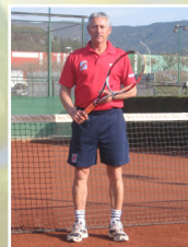
Director: Manuel Rodríguez

DEL 25 DE JUNY AL 27 DE JULIOL I DEL 27 D'AGOST AL 7 DE SETEMBRE DE 5 A 16 ANYS